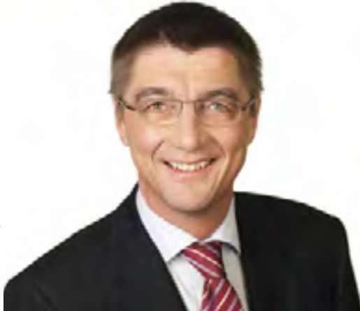
Andreas Schockenhoff Stellv. Vorsitzender der CDU/CSU-Bundestagsfraktion

Am 22. Januar 1963 unterzeichneten Bundeskanzler Konrad Adenauer und der französische Staatspräsident Charles de Gaulle im Pariser Elysée-Palast den deutsch-französischen Freundschaftsvertrag. Das auch als Elysée-Vertrag bezeichnete Dokument verpflichtet Deutschland und Frankreich zu Konsultationen in allen wichtigen Fragen der Außen-, Sicherheits-, Jugend- und Kulturpolitik. Über die Bedeutung des Vertrags sprach „Fraktion direkt“ mit dem Vorsitzenden der deutsch-französischen Parlamentariergruppe und stellvertretenden Fraktionsvorsitzenden Andreas Schockenhoff.