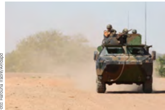
Französische Soldaten im Landesinnern von Mali

Langfristig muss die malische Regierung in die Lage versetzt werden, die Nordhälfte des Landes eigenständig zu kontrollieren. Die EU muss deshalb nun zügig ihre bereits geplante zivile Mission zur Ausbildung und Befähigung der malischen Streitkräfte beginnen.