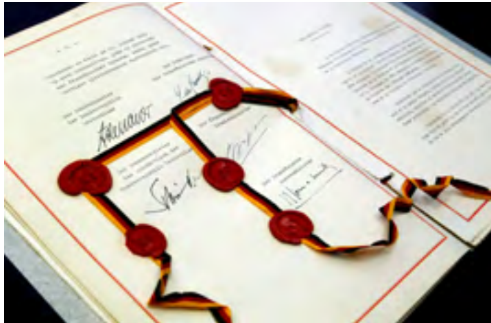
Der Elysée-Vertrag im Original

Schockenhoff erinnerte daran, welchen Mut es brauchte, damit Frankreich und Deutschland wenige Jahre