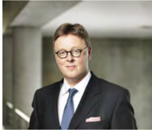
Michael Grosse-Brömer Erster Parlamentarischer Geschäftsführer der CDU/CSU-Bundestagsfraktion

Seit fast drei Jahren kämpfen wir jetzt im Euro-Raum und der Europäischen Union gemeinsam gegen die Folgen der Staatsschuldenkrise. Über die Ursachen besteht Einigkeit: Neben der unzureichenden Regulierung des Bankensektors sind dies vor allem ausufernde Staatsschulden und mangelhafte Wettbewerbsfähigkeit in einigen Mitgliedstaaten. Und genau diese Quellen des Übels gehen wir in der schwarz-gelben Koalition mit unseren Maßnahmen zur Bekämpfung der Krise, mit den wirtschafts- und finanzpolitischen Reformen und mit unseren Forderungen nach europapolitischen Neuerungen an.