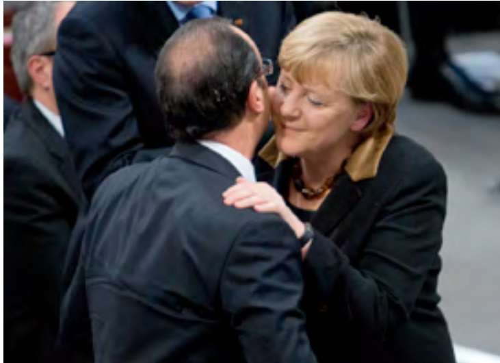
Merkel und Hollande im Bundestag

„Diese Freundschaft ist sehr wertvoll“, sagte Hollande. Sie sei aber untrennbar verbunden mit der europäischen Einigung. Auch Merkel betonte: „Diese Freundschaft ist nicht exklusiv, sie schließt niemanden aus.“ Gleichzeitig hoben beide hervor, dass ohne den deutsch-französischen Mo-