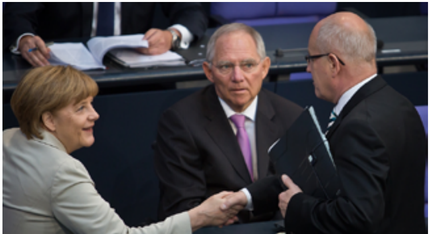
Wolfgang Schäuble mit Angela Merkel und Volker Kauder im Plenum

„Die Bundesregierung hat mehr für die Kommunen getan, als die meisten Vertreter der kommunalen Spitzenverbände erwartet haben“, sagte Schäuble. Die Kosten für die Grundsicherung im Alter und bei Erwerbsminderung von rund 4,5 Milliarden Euro jährlich werden vom Bund vollständig übernommen. Für den Ausbau der Betreuungsplätze für Kinder unter drei Jahren gewährte er Zuschüsse von über 5,4 Milliarden Euro. „Wir haben die Ausgaben um weitere 580 Millionen Euro erhöht, um das Angebot an Kinderbetreuung zu erweitern“, fügte der Finanzminister hinzu.