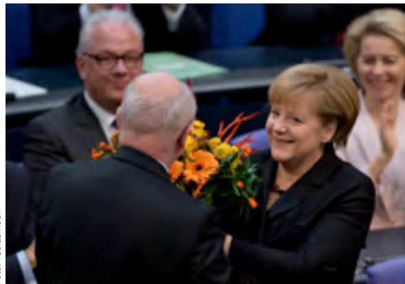
Volker Kauder gratuliert Angela Merkel zur Wiederwahl

Kanzlerin Merkel wurde mit 462 von 621 gültigen Stimmen gewählt.