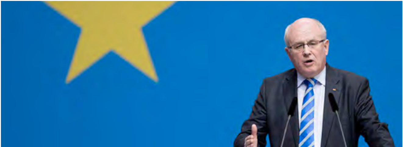
Der Fraktionsvorsitzende Volker Kauder auf dem CDU-Parteitag

Gute Stimmung und klares programmatisches Profil – Die CDU zieht geschlossen und selbstbewusst in den Europawahlkampf. Auf dem CDU-Parteitag am vergangenen Samstag in Berlin rief Bundeskanzlerin und Parteivorsitzende Angela Merkel dazu auf, Europa in den nächsten Jahren konsequent weiterzuentwickeln. Auch die CDU/CSU-Bundestagsfraktion setzte Akzente. Fraktionschef Volker Kauder plädierte dafür, den Wert Europas noch mehr zu schätzen.