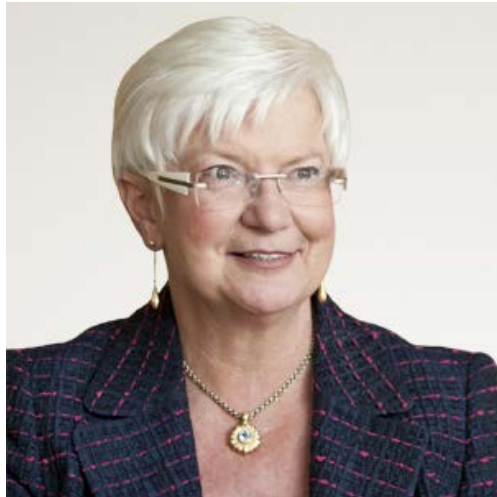
Gerda Hasselfeldt Erste Stellvertretende Vorsitzende der CDU/CSU-Bundestagsfraktion

Die Flüchtlingskrise überlagert derzeit alles: mit der Größe der Herausforderung, mit der Dringlichkeit, mit der Komplexität der Ursachen. Wir können das Problem nur lösen, wenn wir an vielen Stellen und auf verschiedenen Ebenen ansetzen. Genau das tun wir. Die Bretter, die es zu bohren gilt, sind bedauerlicherweise sehr dick. Umso wichtiger werden die Dinge, die wir auf der Haben-Seite verbuchen können. Mit dem Gesetz zur Beschleunigung der Asylverfahren und den Änderungen beim Bleiberecht haben wir in den vergangenen Wochen wichtige Projekte auf den Weg gebracht. Es ist die größte Asylrechtsverschärfung der vergangenen 25 Jahre. Wir dürfen nicht müde werden, das zu betonen. Dazu gehört die Einstufung weiterer Länder des westlichen Balkans als sichere Herkunftsstaaten. Das hat bereits konkrete Ergebnisse gebracht: Der Zustrom aus diesen Ländern ist in den vergangenen Wochen drastisch zurückgegangen.