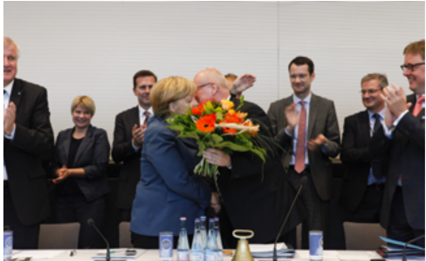
Die Fraktion gratuliert Merkel zum grandiosen Wahlsieg

Mit 41,5 Prozent der Wählerstimmen hat die Union unter Beweis gestellt,